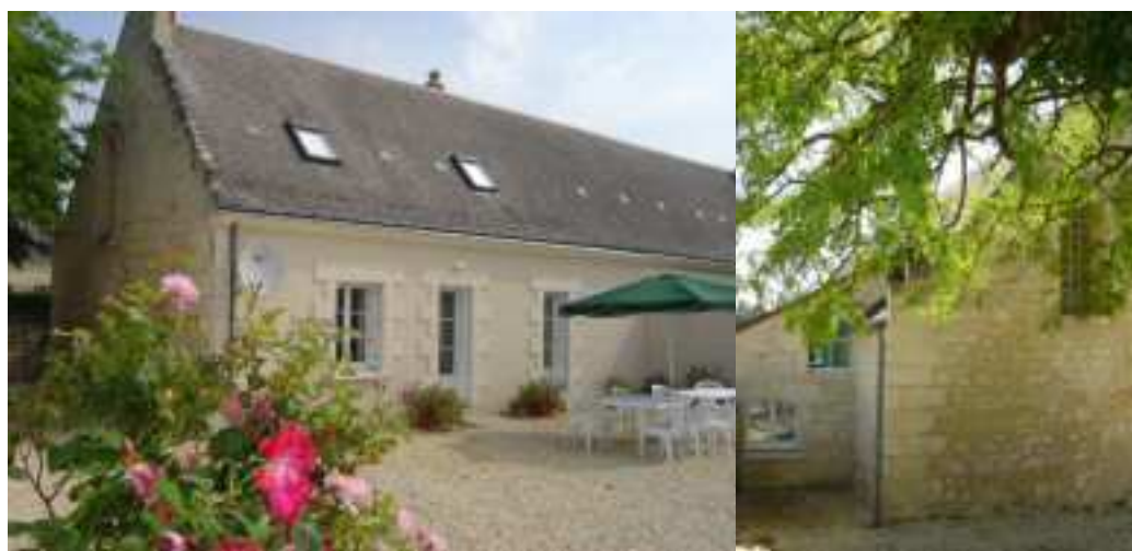
Gîte Rural 10 personnes agrément préfectoral