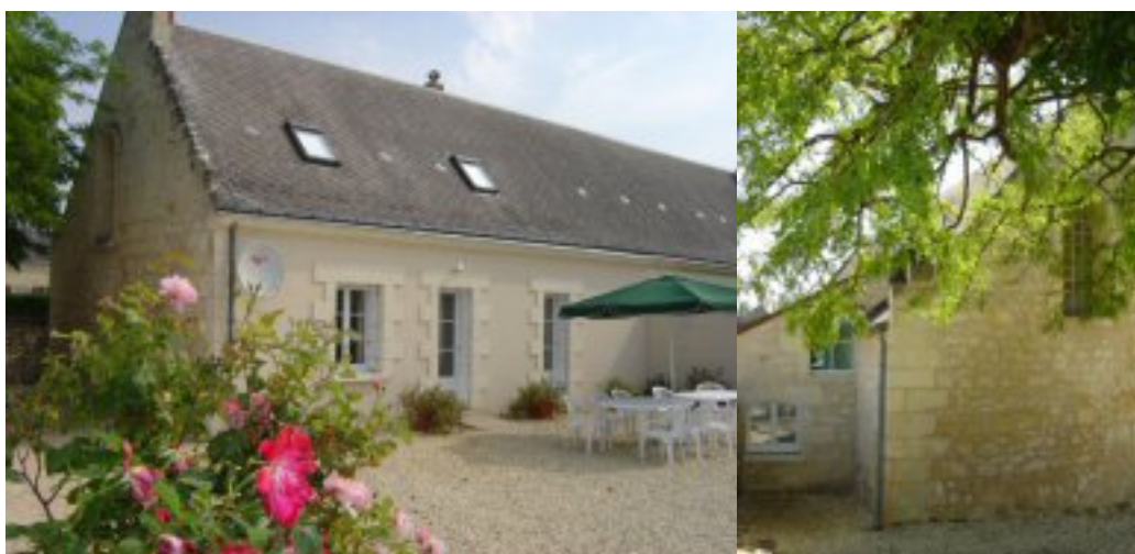
Gîte Rural 10 personnes agrément préfectoral